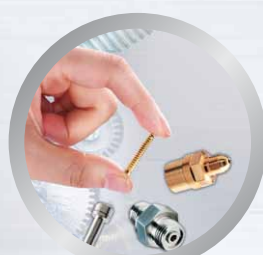
Производство миниатюрных деталей