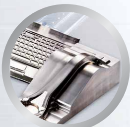
Производство штампов и прессформ