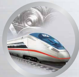
Оборудование для ж/д