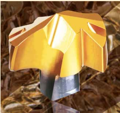
↑ Рис. 3. Быстросменная твердосплавная головка серии DRILLRUSH.

Режущие быстросменные твердосплавные головки (рис. 3) изготавливают из нового сплава марки TT9080, отличающегося большей износостойкостью по сравне-