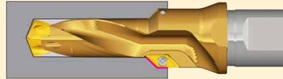
↑ Рис. 7. Схема сверления и дополнительного растачивания за один проход ступенчатого отверстия сверлом DRILLRUSH с боковыми пластинами.

и, как следствие, способствуют повышению точности обработки отверстий.