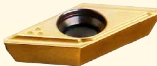
↑ Рис. 5. Боковая пластина A0MT 6.

Дополнительно устанавливаемые под углом 45° две боковые пластины (рис. 5) за один проход формируют требуемую фаску под резьбу (рис. 6).