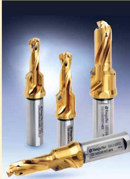
↑ Рис. 4. Комбинированные сверла для получения ступенчатых отверстий.

Специалисты «ТАЕГУТЕК УКРАИНА» имеют солидный опыт в разработке и внедрении таких решений, в том числе и с использованием технологий из серии DRILLRUSH.